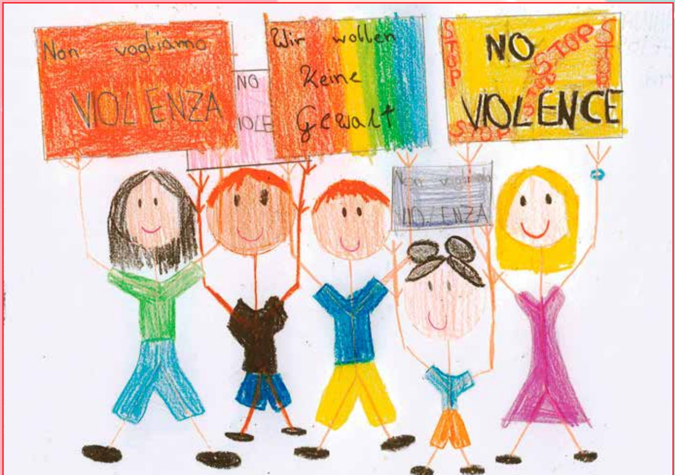
ANINA HEISS IV A - V. Goller

Il rispetto è l'unica soluzione a ogni tipo di violenza, perchè se ognuno avesse rispetto per tutti non esisterebbe la violenza.